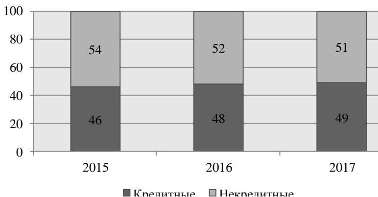
Рисунок 1 – Соотношение организаций с лицензиями профессионального участника рынка ценных бумаг, % [2]

За период 2015-2017 гг. доля кредитных организаций с лицензиями профессионального участника рынка ценных бумаг растёт в среднегодовом выражении на 2,5 %.